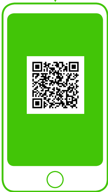
※新型コロナ対策パーソナルサポート (行政) QRコードから登録